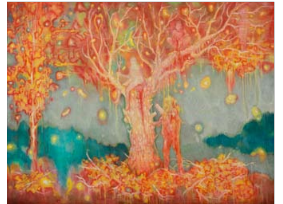
Snovi o trešnji