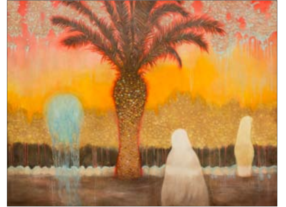
Snovi o pustinji