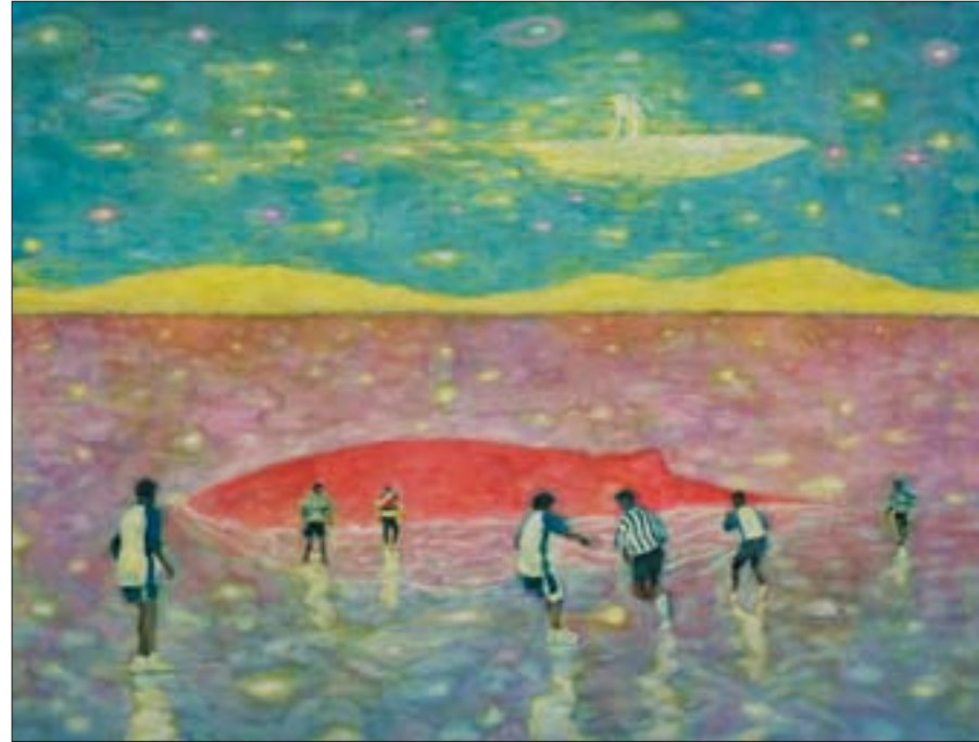
Snovi o kitu