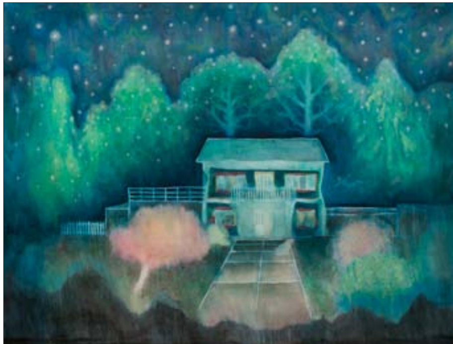
Snovi o umiranju